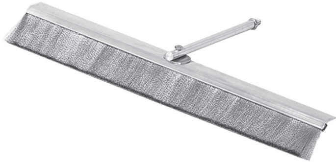
Borstel met een hoek van 45 graden

Wanneer de batterijen moeten worden vervangen, gaat de rode Lo Bat-indicator branden. Om deze te vervangen, trekt u de 2 laden aan de achterkant van de detector naar buiten. Vervang deze voor 2 lithium PP3 batterijen. Zorg dat deze correct worden aangebracht.